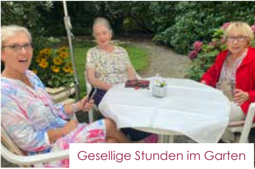
Gesellige Stunden im Garten