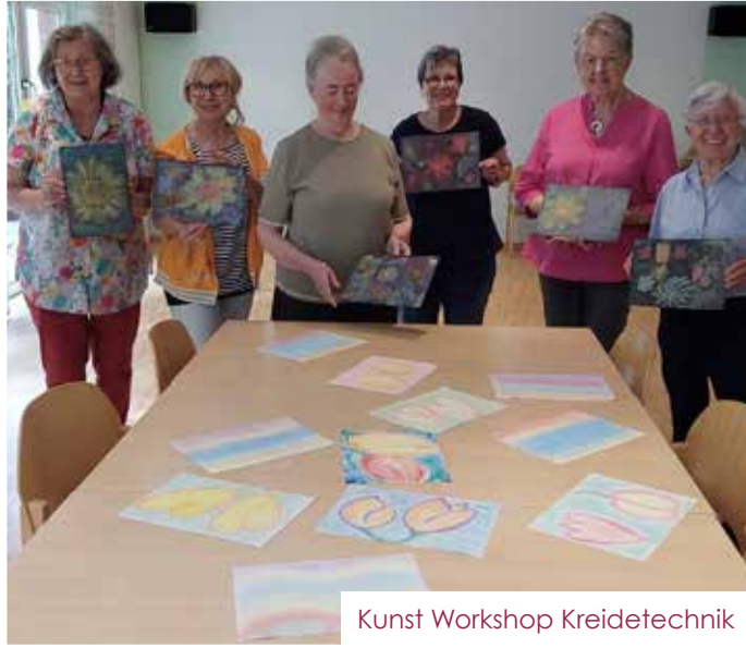
Kunst Workshop Kreidetechnik