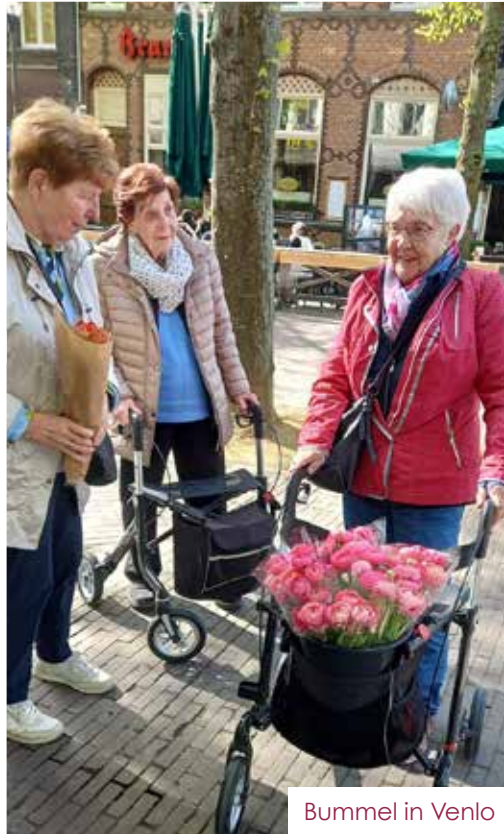
Bummel in Venlo