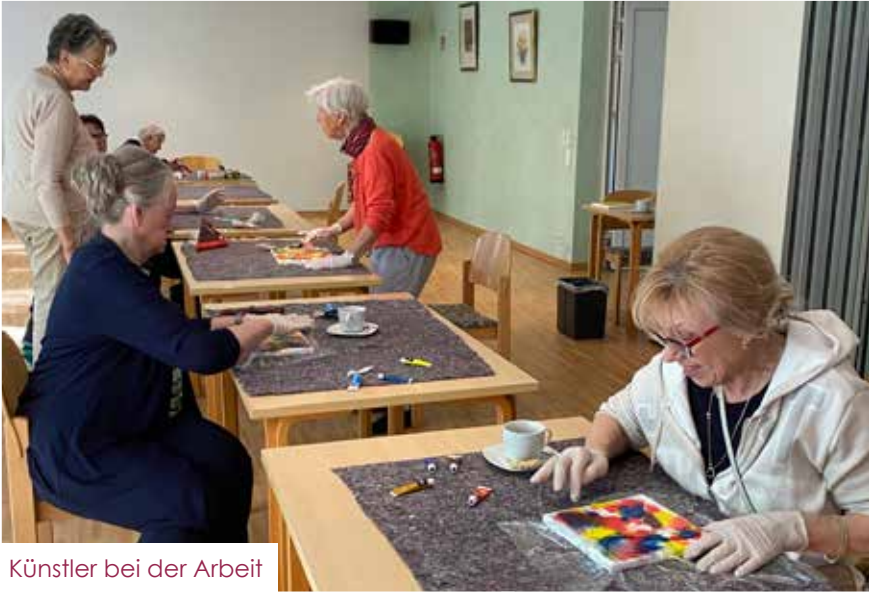
Künstler bei der Arbeit